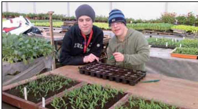
Děti v zahradnictví.