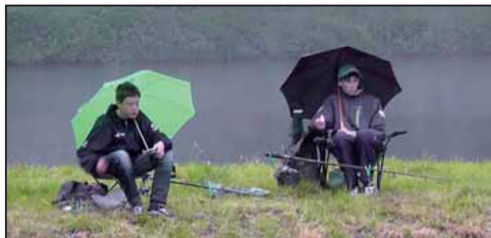
Dětské rybářské závody.