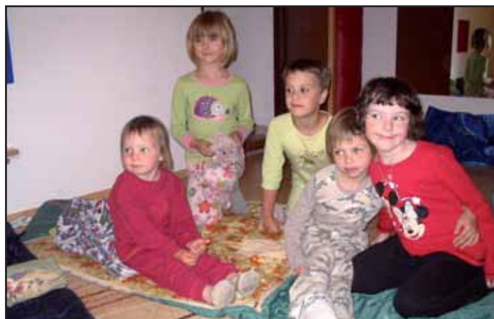
Nocování v Kalíšku.