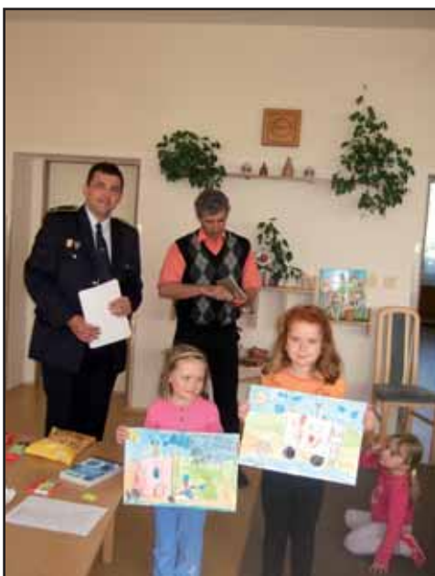
Předávání cen požární soutěže.

Všechny děti s velkým nasazením ukázaly veřejnosti svůj talent a své maminky potěšily vlastnoručně vyrobenými srdíčkovými taškami se svým portrétem, ve které mohly maminky nalézt netradiční dáreček v podobě batikovaného prostírání vytvořeného samotnými dětmi.