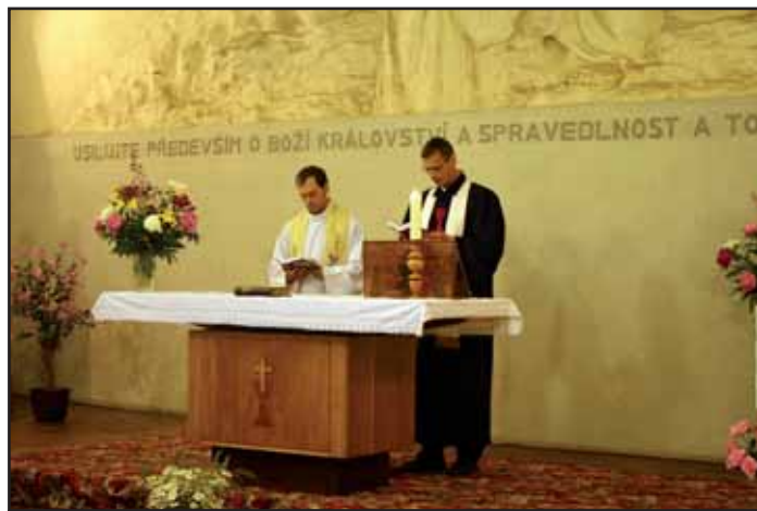
Ekumenická bohoslužba v Husově sboru.

Vše začalo v podvečer ekumenickou bohoslužbou v Husově sboru. Oikumené (řec.) -společné obydlí, zde společné dílo křesťanských církví. Ještě před dvěma desetiletími bylo nemyslitelné, aby katolický kněz stanul v pro-