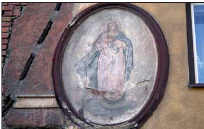
Obraz Panny Marie nutně potřebuje opravu.