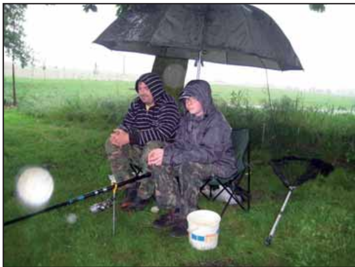
Dětské rybářské závody.