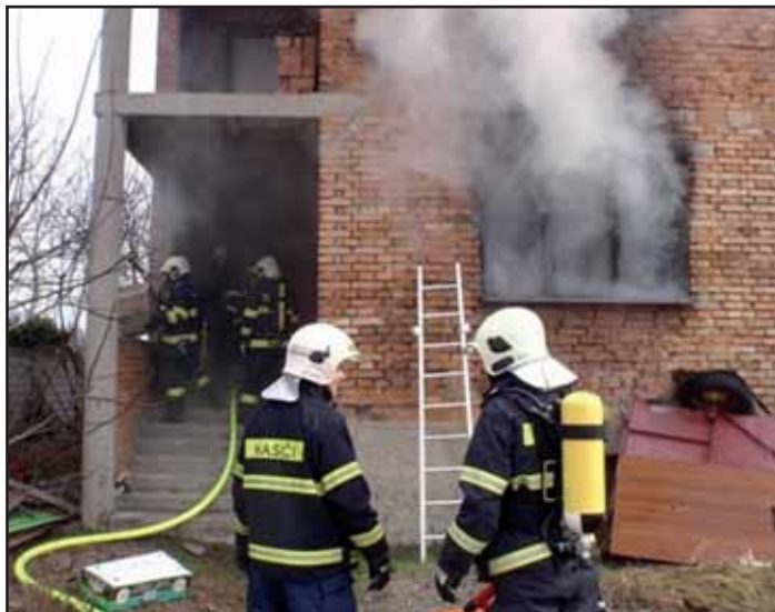
Požár v Bělovské ulici.

Dne 26. března 2011 v 09:12 hod. byli hasiči informováni o požáru rodinného domu v obci Kvasice. Na místo vyjely dvě jednotky profesionálních hasičů z Otrokovic a Kroměříže, které posílila jednotka dobrovolných hasičů z Kvasic. Ze Zlína na místo vyjel také velící důstojník směny. Po příjezdu na místo bylo zjištěno, že došlo k požáru v rodinném domě. Svědci události nahlásili na tísňovou linku, že jsou vidět plameny z okna rodinného domu, který navíc sousedí s dalším domem. Při požáru došlo k popálení jednoho muže z domu, kterému byla na pomoc přivolána posádka zdravotnické záchranné služby. Jako první k hořícímu domu dorazila místní jednotka dobrovolných hasičů, následována cisternami profesionálů. Byl potvrzen rozsáhlejší požár uvnitř místnosti. Zraněný muž se dostal mimo nebezpečí. Hasiči postupně rozvinuli útočné vodní proudy a pronikli do hořícího domu. Hasiči rychlým zásahem zabránili zasažení dalších objektů a uchránili tak další majetek před poškozením. Podle informací lékaře bude zraněný a popálený muž převezen na specializované pracoviště do nemocnice v Brně.