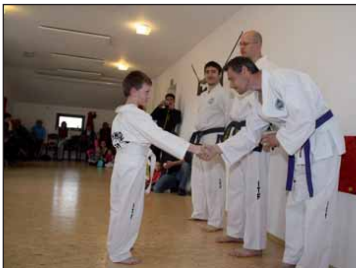
Páskování v Taekwon-Do ITF.