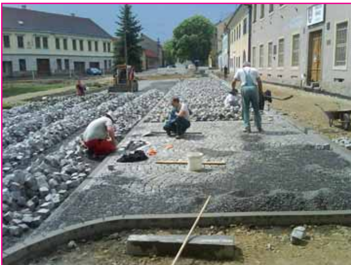
Městečko dostává novou podobu.