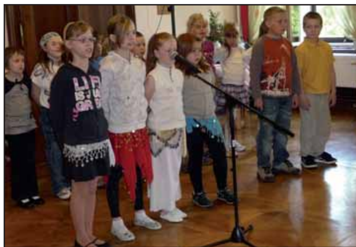
Vystoupení dětí pro seniory.