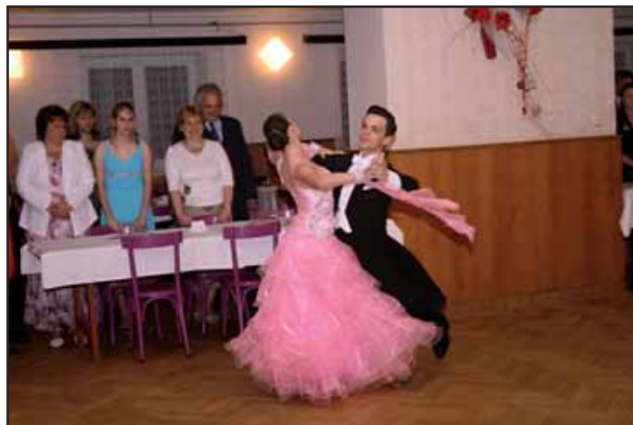
Májová veselice 2011.