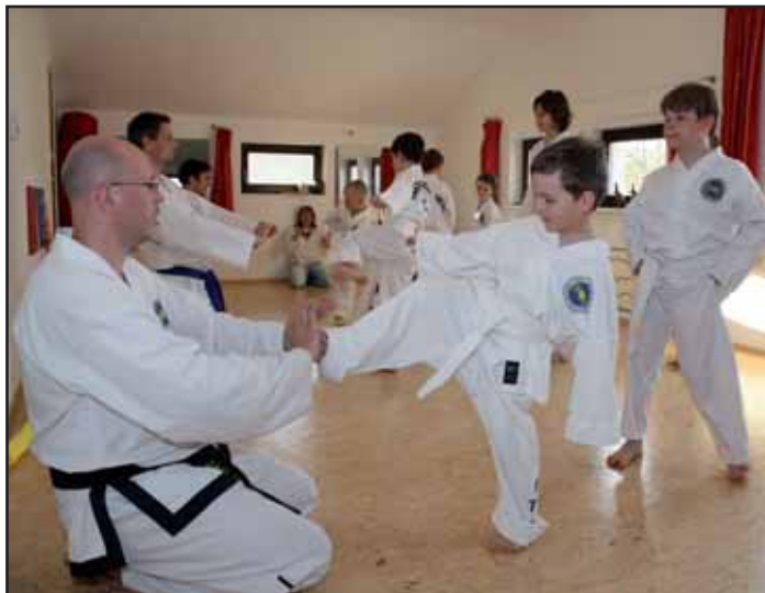
Páskování v Taekwon-Do ITF.