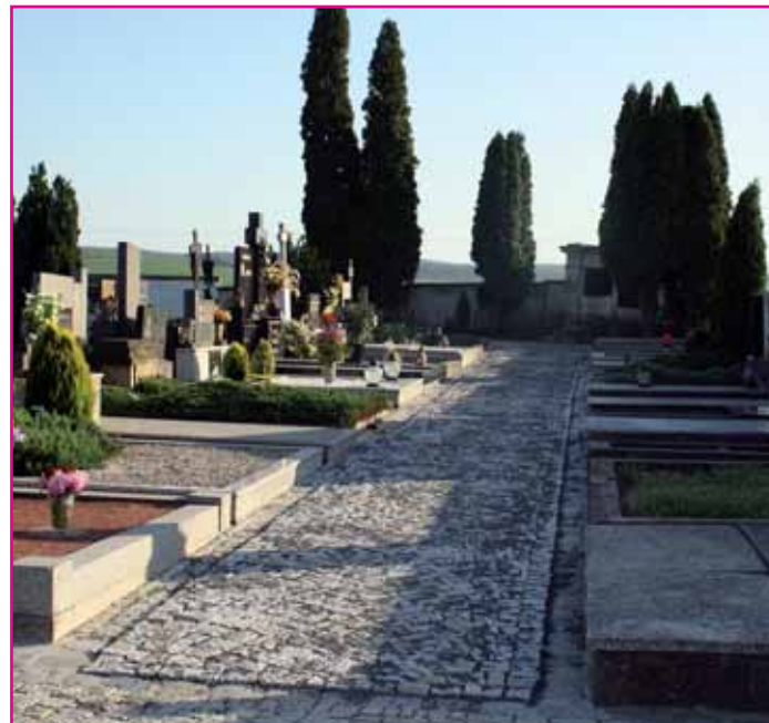
Nové chodníky na hřbitově.