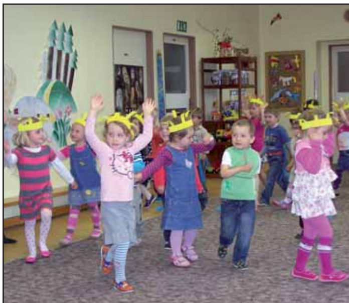
Besídka ke dni Matek.