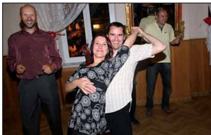
Májová veselice 2011.