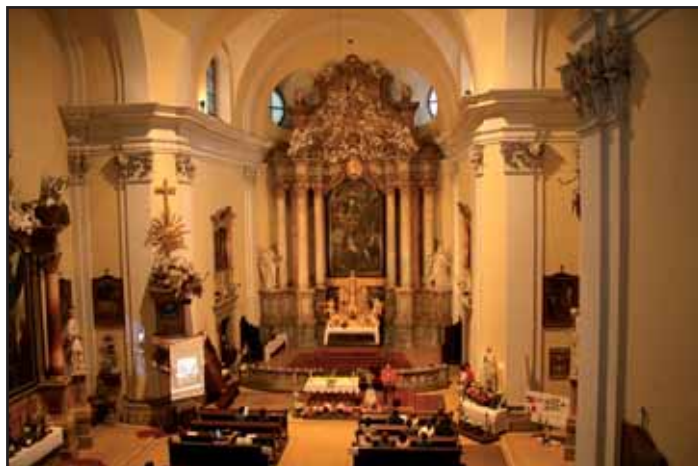
Pohled na loď římskokatolického kostela.

Nejstarší a historicky nejceněnější kvasický kostel na hřbitově prošel i za poslední století pestrým vývojem. V r. 1899 vyhořel a následující dílčí opravy dílo zkázy spíše doplnily. Přelom s návratem historické podoby přišel až v devadesátých letech minulého století. Touto dobou je datována též obnova pravidelných sobotních bohoslužeb v letní části roku.