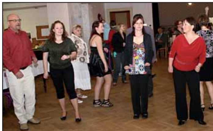
Májová veselice 2011.

Pořadatelé věří, že příští rok se zase sejdem na „Májové“ a to ještě v hojnějším počtu než letos. Aleš Judas